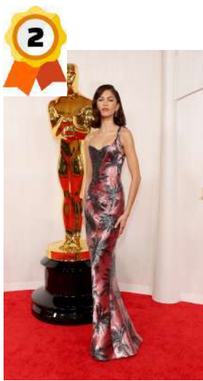
Zendaya en Armani Privé et bijoux Bulgari

Mais pour nous, rédactrices de cet article, notre top 1 est Emma Stone, actrice de renom, qui d'ailleurs gagna l'Oscar de la meilleure actrice, ce qui lui vaut bien une première place dans notre classement, même si lors de la remise de prix, sa robe était cassée.