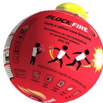
Block fire neuve

L'extincteur traditionnel pèse 2,5 kilos, alors que la Block fire ne pèse qu'1,3kg pour 15cm de diamètre. Elle a été élue produit de l'année 2024.