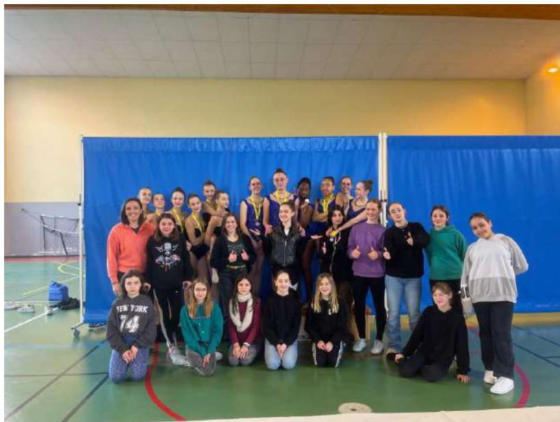
Photo des qualifications au championnat de France UNSS 2023

Les engins du championnat de France 2023 étaient les massues.