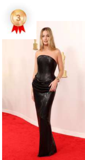
Margot Robbie en Versace

Il ne suffit pas d'avoir gagné un prix ou d'être nommé pour bien s'habiller.