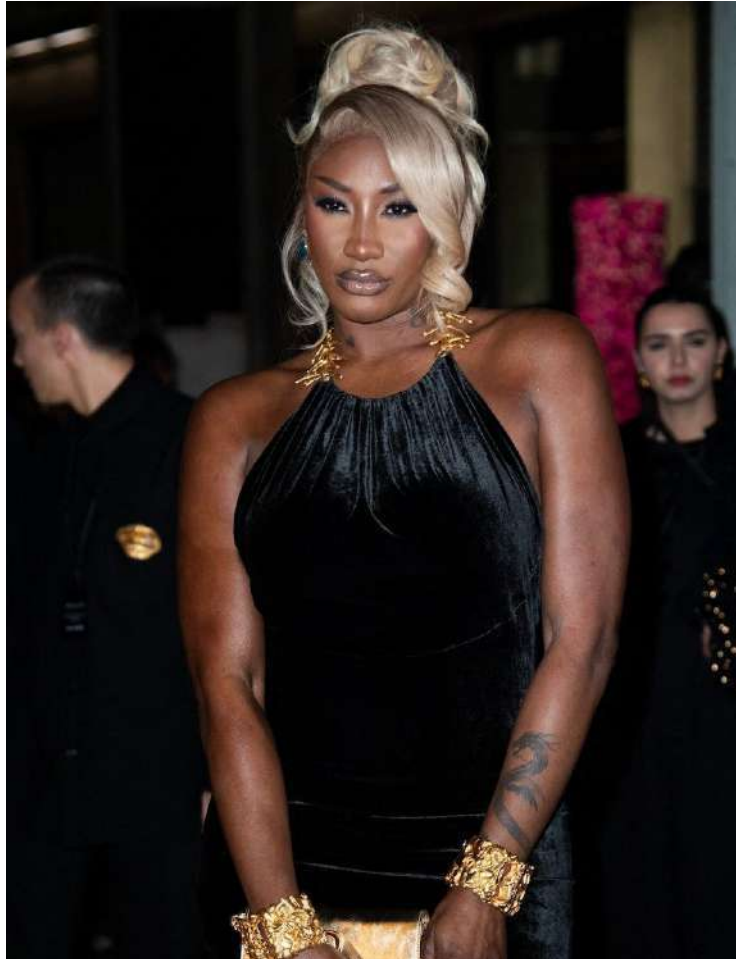
Léana Perdigao Madyson Watrin 4H

La célèbre chanteuse francophone Aya Nakamura chantera peut-être un célèbre titre d'Édith Piaf lors des J.O 2024 à Paris.