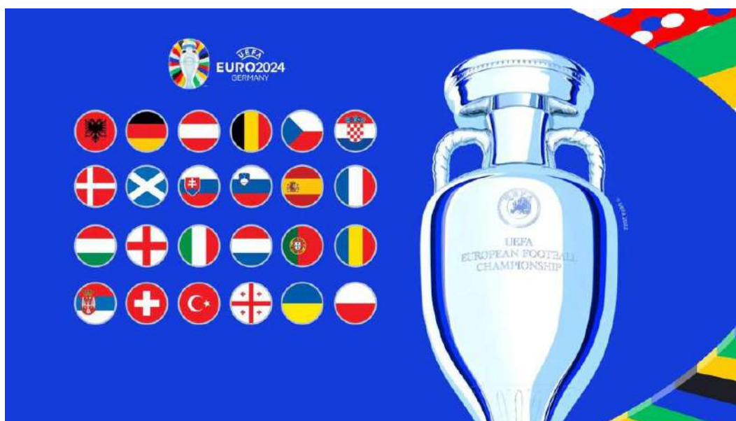
Image provenant du site EURO 2024

Au cours de cette 17 e édition, ce sont 24 équipes qui s'affronteront pour tenter de remporter ce titre de champion d'Europe, disputé tous les 4 ans. Le champion en titre est l' Italie . Les favoris sont l'Allemagne, le Portugal et l'Espagne. La France, quant à elle, tentera de décrocher sa 3 ème Coupe d'Europe, après deux victoires en 1984 et 2000 .