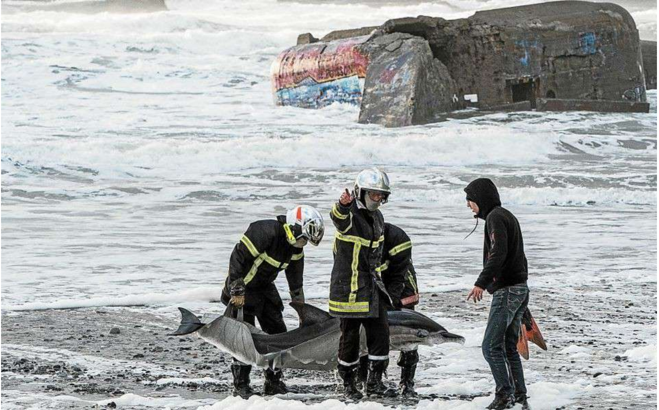
un dauphin sauvé par des pompiers

Un jeune dauphin a été retrouvé échoué sur la plage de Noirmoutier. Des pompiers ont réussi à le remettre à la mer.