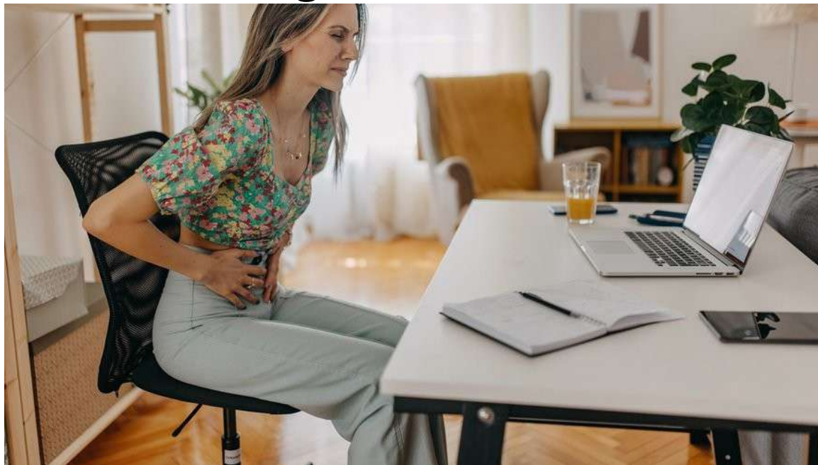
Femme souffrant des douleurs de règle au travail.