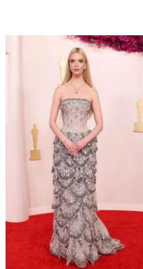
Anya Talor-Joy en Dior Haute Couture et en bijoux Tiffany & Co

Elle n'a malheureusement pas été nommée dans la catégorie de la meilleure actrice. Mais avec cette tenue marron elle casse l'image de la Barbie habillée tout de rose, ce qui pour nous lui vaut bien la 3ème place.