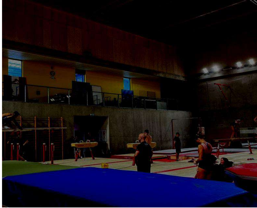
12 gymnastes britanniques s'entraînent à René Tys pour les JO