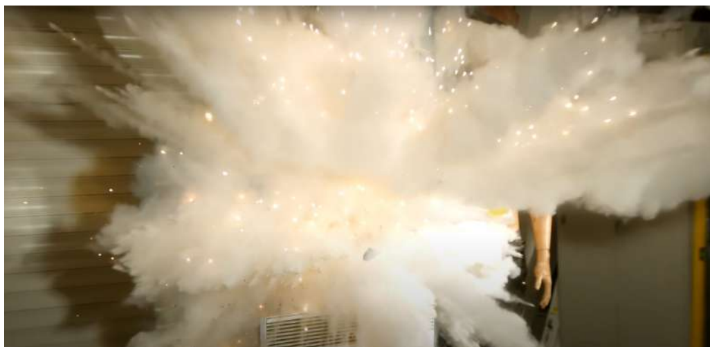
Explosion de la block fire au contact du feu

Cette invention, qui allégera la tâche des pompiers, permettra de se consacrer au feu de forêts : si tout le monde l'a chez soi il n'y aura presque plus de feux domestiques.