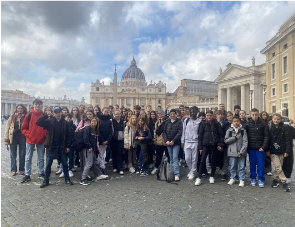
Élèves du collège Paulette Billa sur la Place Saint Pierre, Rome, Italie.

Ce 18 février 2024, les 5 e , 4 e , 3 e LCA et la classe de 4 e C sont partis pour Rome. Ils ont pris la route à 11h du collège Paulette Billa, pour arriver à 8h, le lendemain matin. La nuit n'a pas été très confortable pour beaucoup mais un super petit déjeuner au restaurant les attendait au restaurant « Antica Osteria croce ».