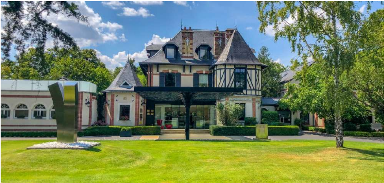
Vue extérieure du restaurant de Arnaud Lallement

À Tinquex, le restaurant « L'Assiette Champenoise » rentre dans le top 3 des meilleurs restaurants au monde.