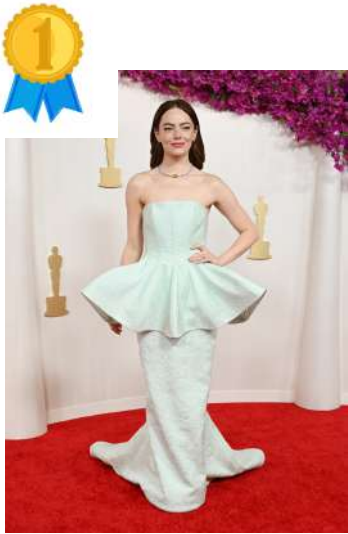
Emma Stone en Louis Vuitton et en haute joaillerie Louis Vuitton

Les Oscar, une cérémonie qui récompense les meilleurs acteurs de l'année, ont eu lieu dans la nuit du 10 au 11 mars. Comme chaque année, le tapis rouge a vu des looks de star audacieux. Voici notre top 5 des plus belles tenues. Alors serez-vous d'accord ou, pour vous, est-ce un fashion faux pas ?