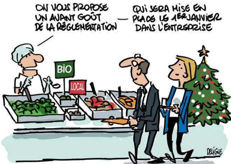
Caricature de personnes en restauration le 1 er Janvier 2024

La loi Egalime a fait en sorte, le premier janvier 2024, que les cantines d'écoles et d'entreprises soient meilleures en qualité et en durabilité en votant des changements.