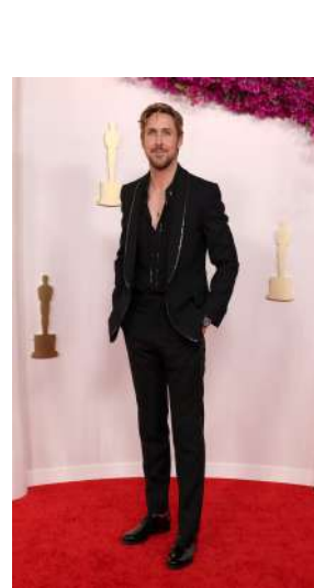
Ryan Gosling en Gucci

L'actrice de Dune 2 et du Jeu de la Dame était parée d'une sublime robe Dior tapissée de plumes argentées. Dotée d'une coupe bustier composée de pétales de tulle de soie brodé ivoire et gris, la robe a été réalisée spécifiquement pour l'apparition de l'actrice, fan des robes scintillantes. Ce qui lui vaut sa 4ème place.