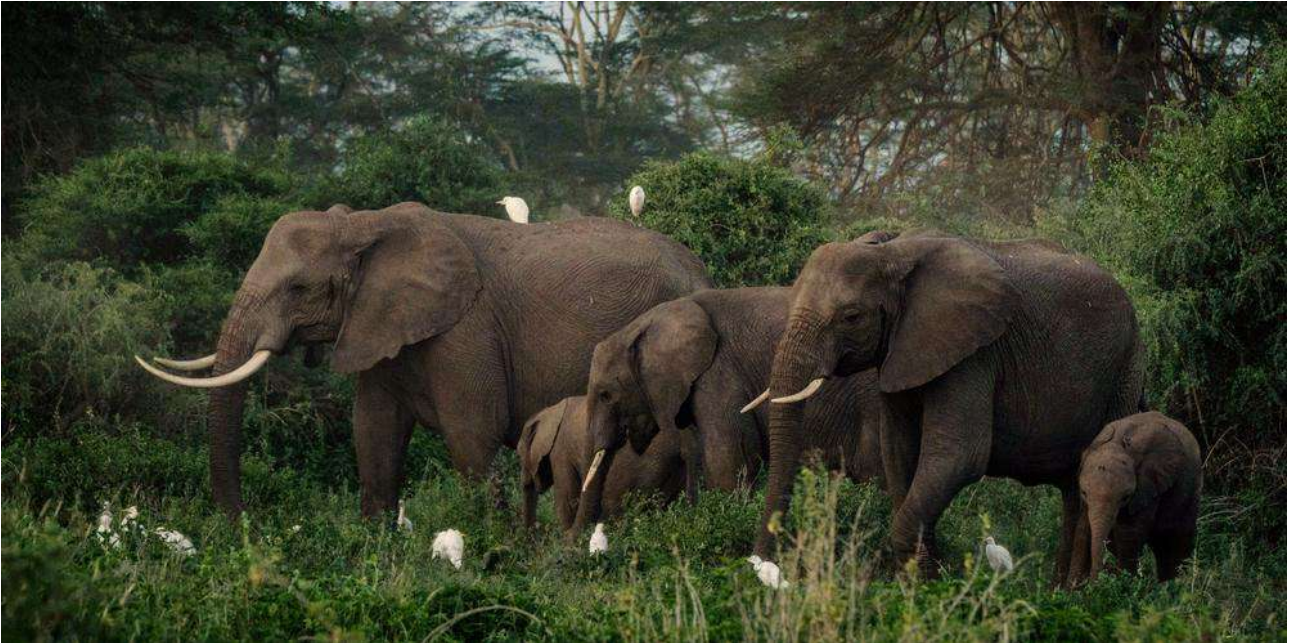
Des éléphants dans une réserve naturelle du Bangladesh

Le 25 février 2024 au Bangladesh, la Haute Cour de Dacca a interdit l'adoption d'éléphants sauvages d'Asie.