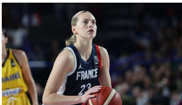
La basketteuse française Marine Johannès

Par ailleurs, les joueuses de l'équipe de France féminine de basket, médaillées de bronze aux Jeux Olympiques de Tokyo en 2020 et grand espoir de médaille pour Paris 2024, viendront s'entraîner à l'Aréna de Reims, du 16 au 22 juillet 2024. Le 1 er août dernier, 12 gymnastes se sont entraînés au Complexe René Tys.