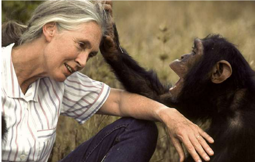
Jane Goodall en compagnie d'un chimpanzé.

Une femme amoureuse de la nature qui passa une partie de sa vie dans la jungle de Gombe en Tanzanie.