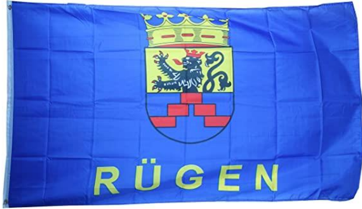
Die Flagge von Rügen

Rügen ist eine Insel in der Ostsee Deutschlands