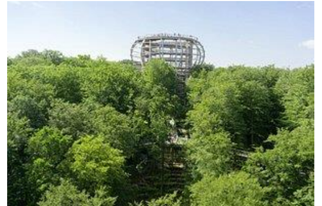
Naturerbe Zentrum Ruegen