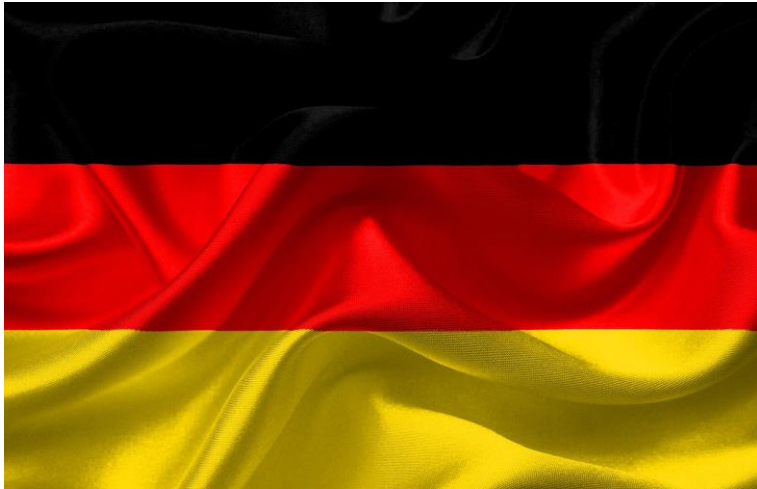
Die Flagge von Deutschland