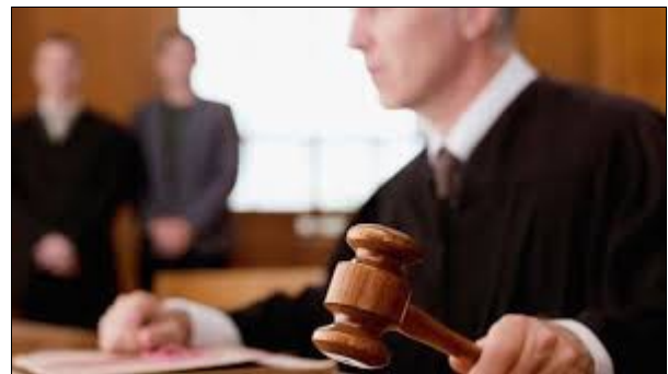
Image d'un juge

Nous nous présentons en utilisant notre identité légale en revanche nous nous définissons souvent grâce à notre identité personnelle. Celle-ci se définit par notre origine, notre religion, notre famille ou encore nos centres d'intérêts. À travers notre histoire personnelle, nos goûts peuvent varier grâce à de multiples rencontres et expériences au cours de notre vie. Cette identité n'est donc jamais figée.